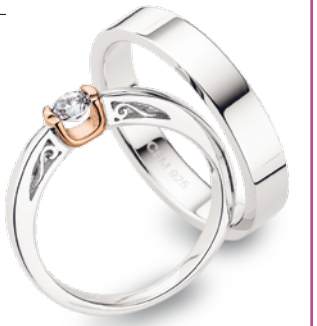
F7-035 Ring Zirkonia*