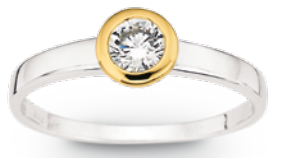
F7-037 Ring Zirkonia*