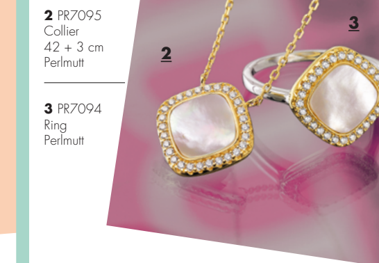
2 PR7095 Collier 42 + 3 cm Perlmutter