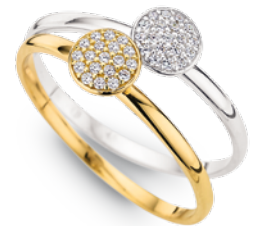
F7-036 Ring Zirkonia*