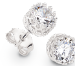
PR7018 Collier 43 + 3,5 cm