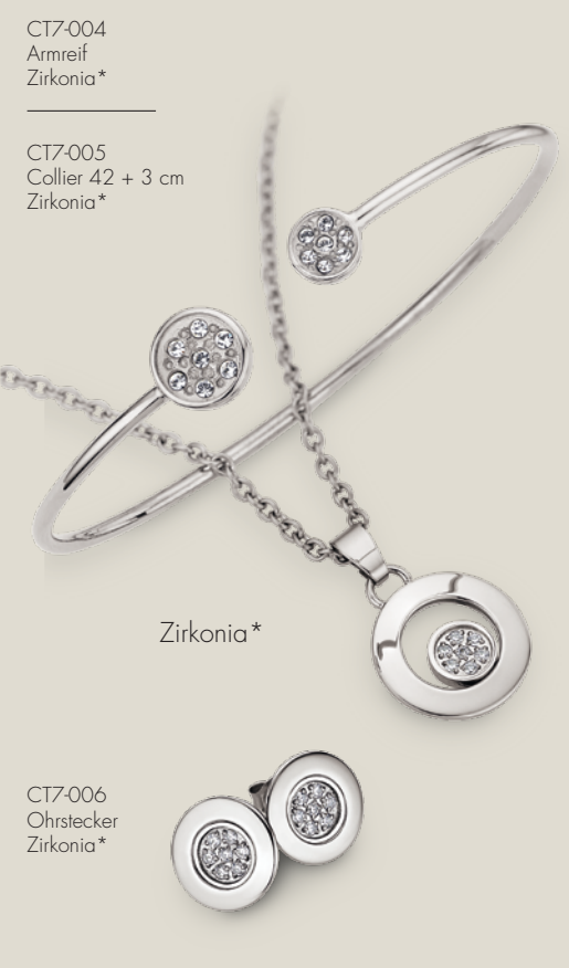
CT7-004 Armreif Zirkonia*