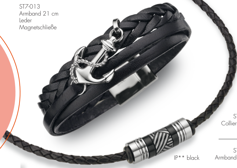
ST7-013 Armband 21 cm Leder Magnetschließe