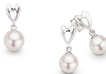
PR7086 Ohrhänger Süßwasser-Zuchtperle