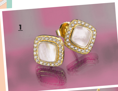
1 PR7096 Ohrstecker Perlmutter