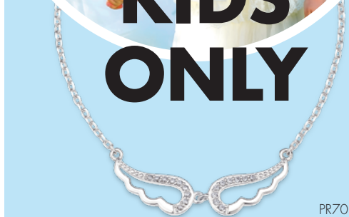
PR7034 Collier 42 + 2 cm