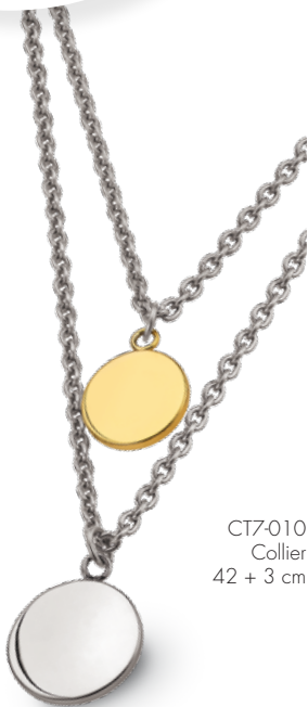
CT7-010 Collier 42 + 3 cm