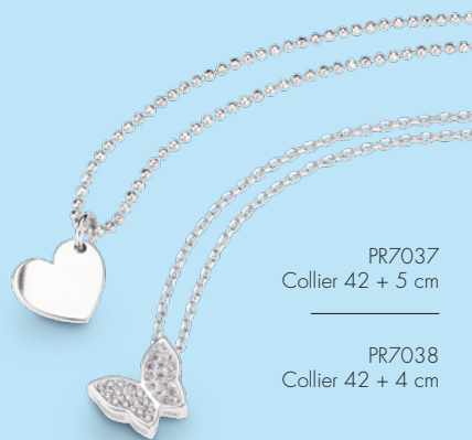
PR7037 Collier 42 + 5 cm

Designbeispiel Alle Sternzeichen verfügbar.