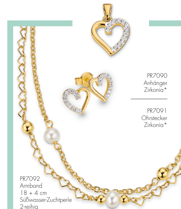
PR7090 Anhänger Zirkonia*

Merken Sie sich die Koordinaten und steuern Sie auf eine Punktlandung zu. Ein Planet voller Schönheiten erwartet Sie. Three, Two, One, Lift off!