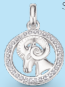
BST925/WI Sternzeichen WIDDER

Designbeispiel Alle Sternzeichen verfügbar.