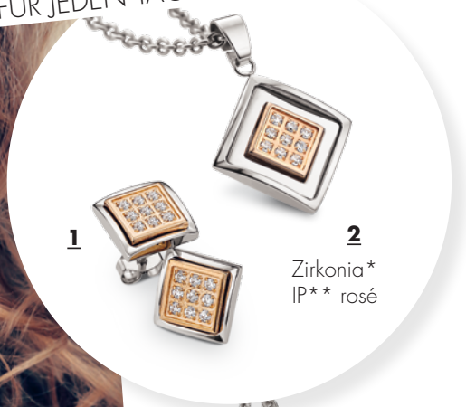
1 CT7-002 Ohrstecker

Ein leichter Duft, leichte Kleidung und leichtes Essen. Wir wollen uns immer und überall leicht und ohne Ballast fühlen. Atmen Sie durch – hier kommt die neue CEM Titan-Kollektion. Stylish, allergieneutral, vor allem: leicht!