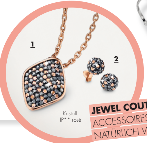
Kristall IP** rosé

JEWEL COUTURE STAR ACCESSOIRES, DIE DICH NATÜRLICH WIRKEN LASSEN