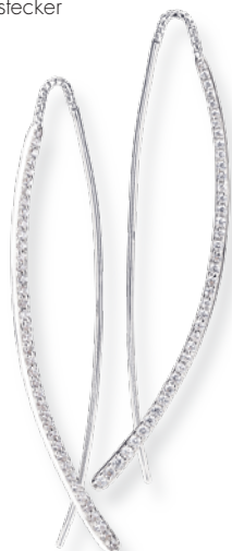
PR7081 Ohrhänger Zirkonia*