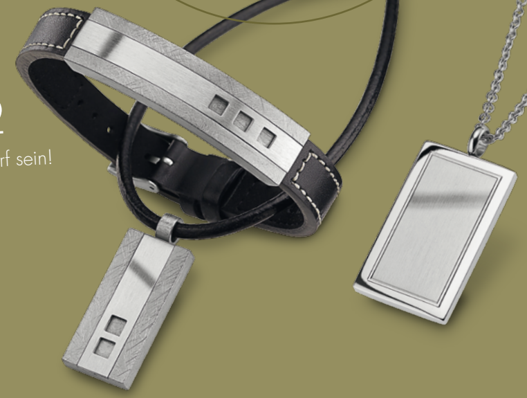
ST7-020 Collier 50 cm