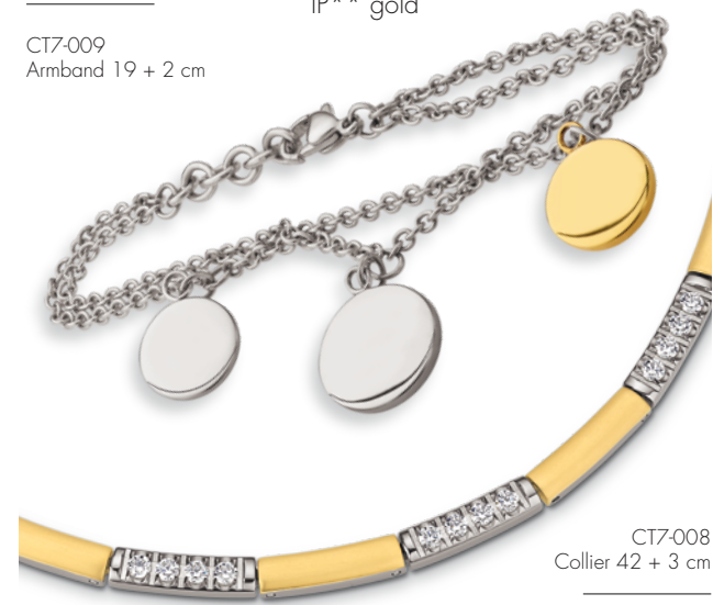
CT7-008 Collier 42 + 3 cm