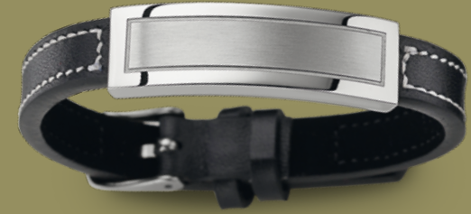
ST7-019 Armband 23 cm